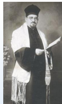
הרב אליהו פנחס ברזילאי