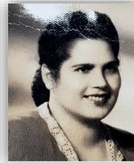
דייזי ארוך חלגואה